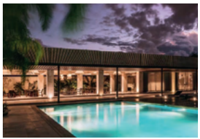
El Cortijo Residencial