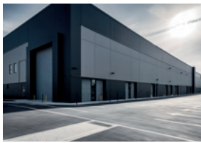
Nodo Parque Industrial