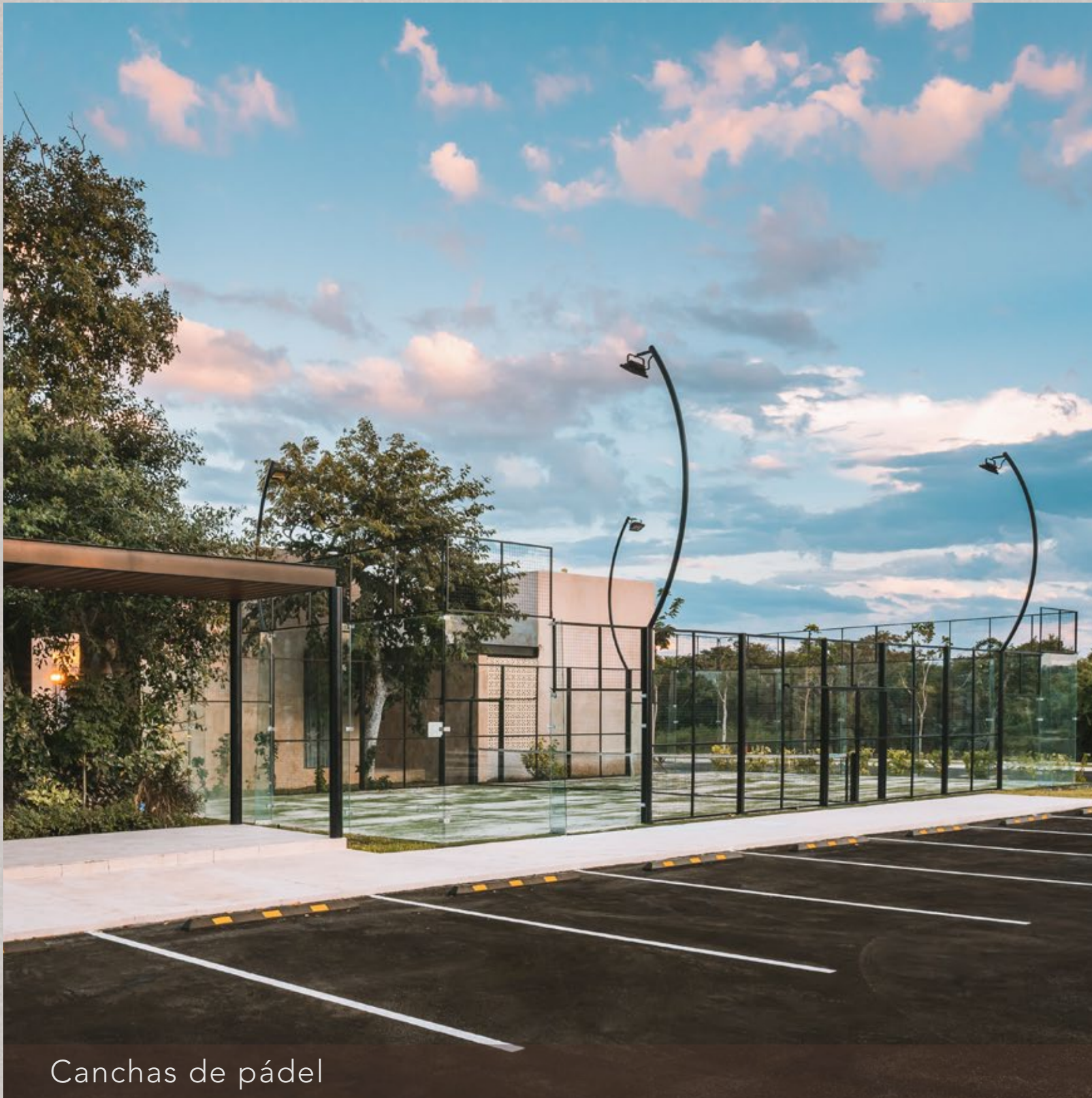
Canchas de pádel