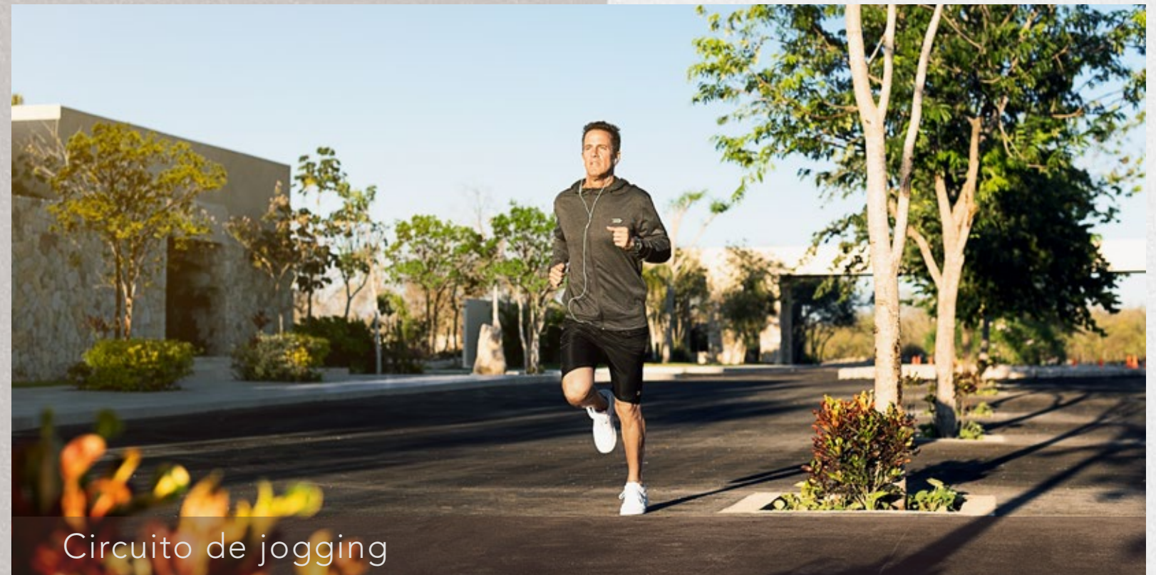
Circuito de jogging